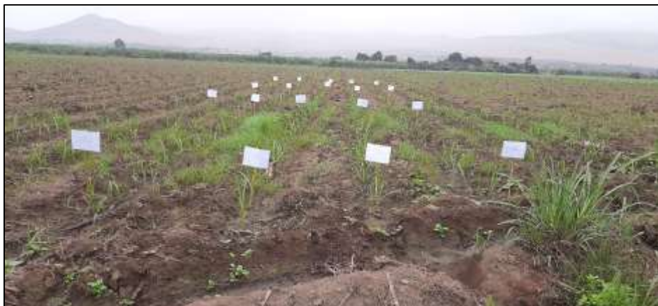
Figura 3. Área del campo experimental.

El trabajo de investigación se realizó en AIPSA – Paramonga, distrito de Paramonga, provincia de Barranca, está localizado a 210 km al norte de Lima con una altitud de 20 msnm Latitud: 10°68'00,61" Sur, Longitud: 77°82'00,10" Oeste, la temperatura promedio de la zona en estudio fue de 18°C, presentando precipitación 1,4 mm, zona ecológica (costa subtropical), campo ecológico (H.R 85%, horas sol: 4 horas, evaporación 2,80 mm, con suelos de una textura franco arcillosa; el área de investigación tiene una superficie plana como se muestra en la figura 3.