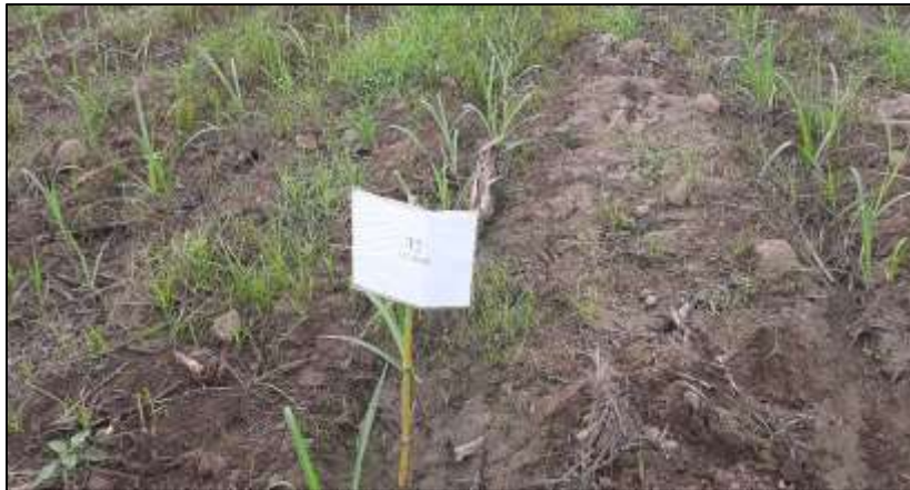
Figura 9. Segundo tratamiento pre aplicación.