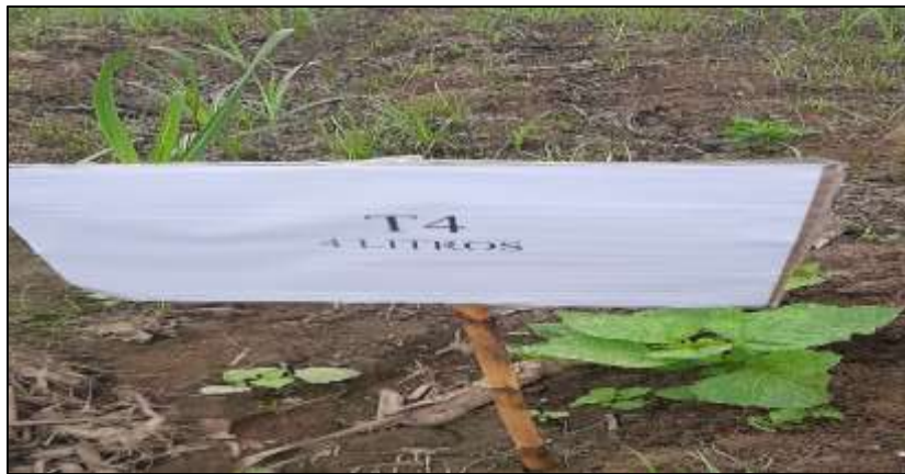
Figura 13. Cuarto tratamiento pre aplicación.