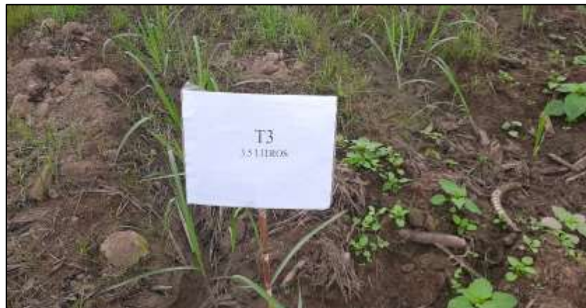
Figura 11. Tercer tratamiento pre aplicación.