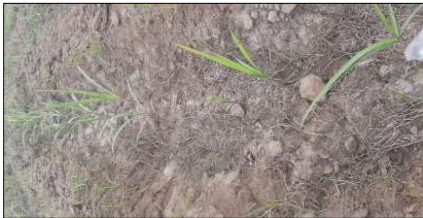
Figura 14. Cuarto tratamiento post aplicación.