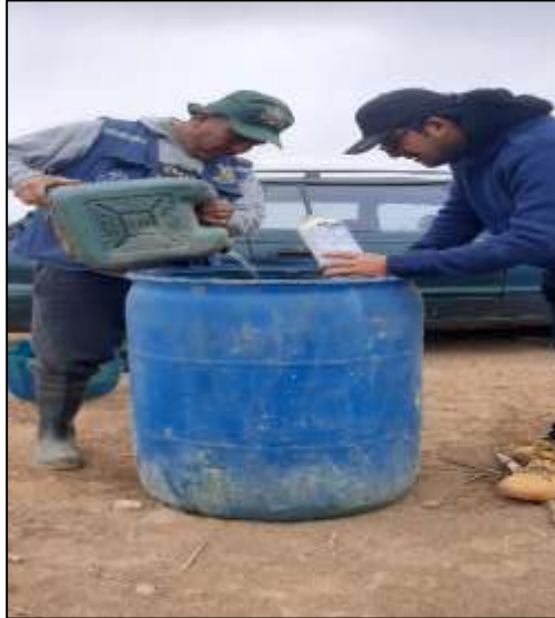
Figura 1. Preparación de tratamientos.

tratamiento, se agregó 0,50 m en ambos laterales para las calles donde se transitó para las aplicaciones. La preparación del tratamiento se muestra en la figura 1. La dimensión del campo experimental fue de 62,5 m de largo y el ancho de 8,5 m (531,25 m 2 ).