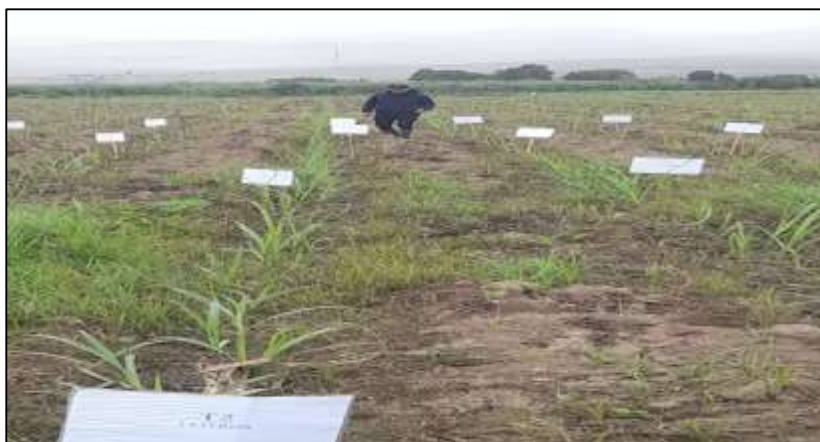
Figura 6. Ubicación de tratamientos en campo.