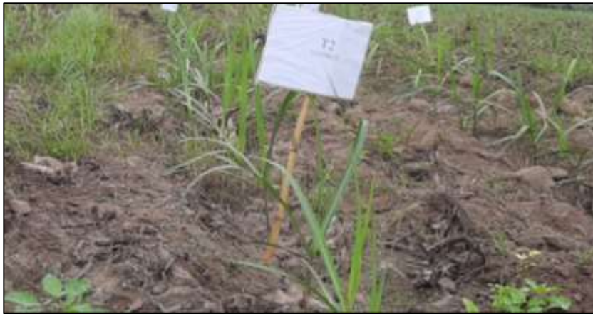
Figura 10. Segundo tratamiento post aplicación.