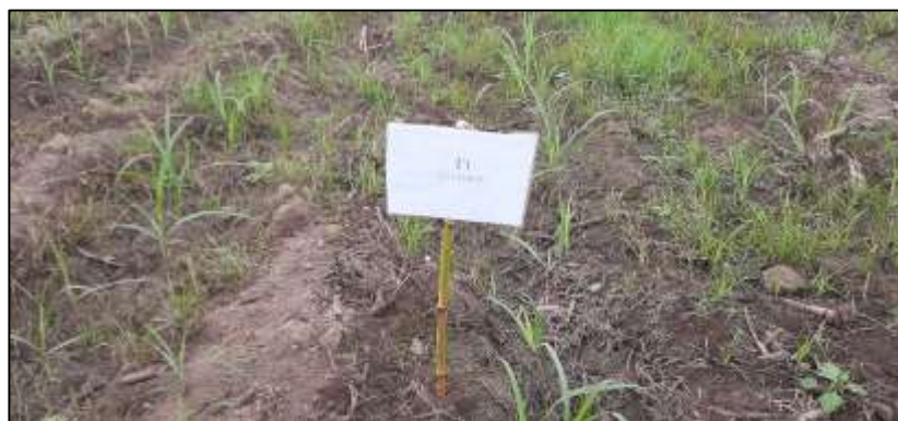
Figura 7. Primer tratamiento pre aplicación.