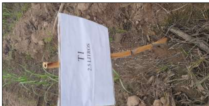
Figura 8. Primer tratamiento post aplicación.