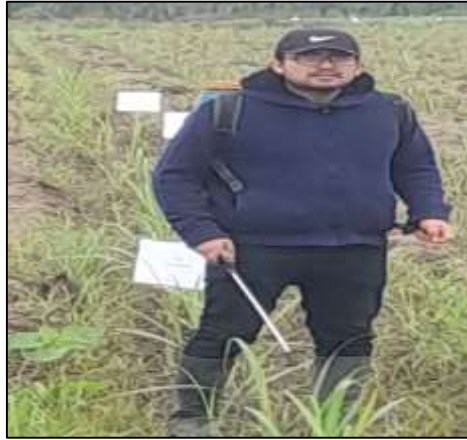
Figura 2. Aplicación de tratamientos.

El trabajo de investigación se realizó en AIPSA – Paramonga, distrito de Paramonga, provincia de Barranca, está localizado a 210 km al norte de Lima con una altitud de 20 msnm Latitud: 10°68'00,61" Sur, Longitud: 77°82'00,10" Oeste, la temperatura promedio de la zona en estudio fue de 18°C, presentando precipitación 1,4 mm, zona ecológica (costa subtropical), campo ecológico (H.R 85%, horas sol: 4 horas, evaporación 2,80 mm, con suelos de una textura franco arcillosa; el área de investigación tiene una superficie plana como se muestra en la figura 3.