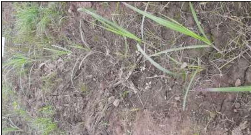
Figura 12. Tercer tratamiento post aplicación.