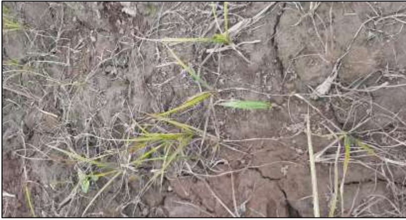
Figura 15. Efecto de control de tratamiento empleado.